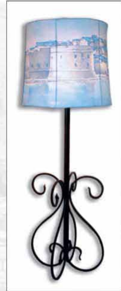
SVJETILJKE DUBROVNIK 3