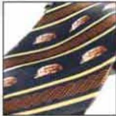
KAR-01 100% svila