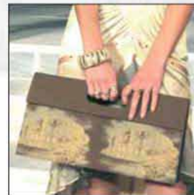
TORBA T-04AR-03 100% koža 100% pamuk