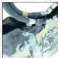
TORBA T-02OP-03 100% pamuk