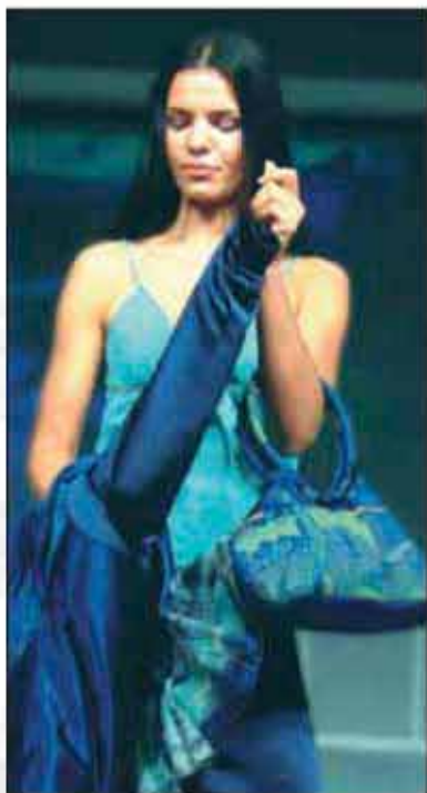
TORBA T-02OP-01 100% svileni saten