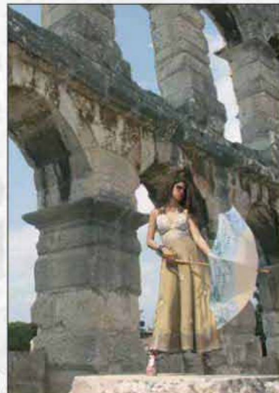
KIŠOBRAN ARENA AR-02