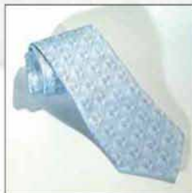
KPL-02 100% svila