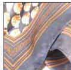
MARAMA AR-02 90x90cm 100% svila