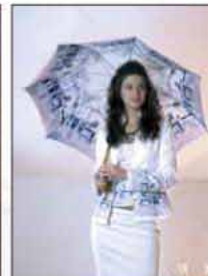
KIŠOBRAN ZAGREB ZG-01