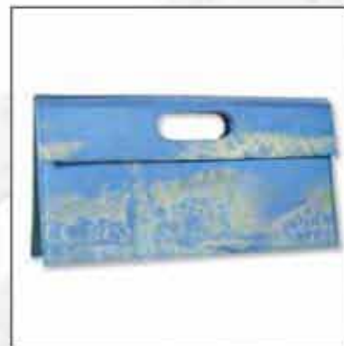
TORBA T-04OP-01 100% svileni saten