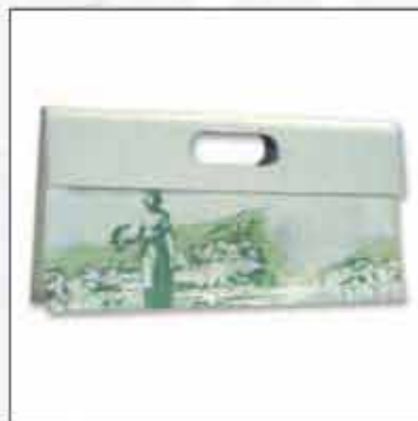
TORBA T-04OP-02 100% pamuk