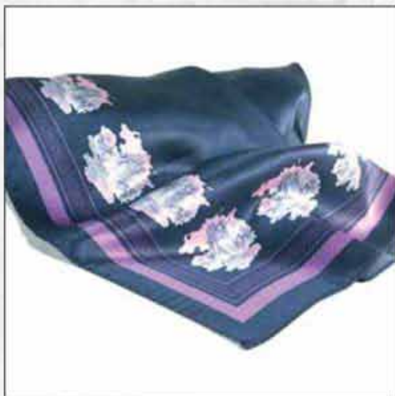
MARAMA PL-01 90x90cm 100% svila