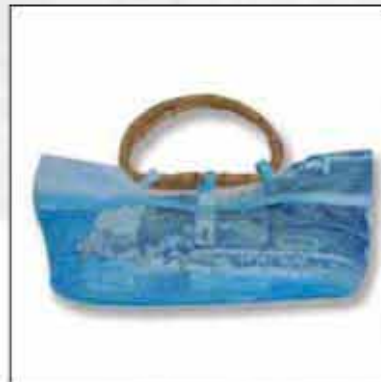
TORBA T-02DU-02 100% pamuk