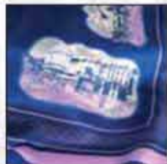
MARAMA ZG-01 90x90cm 100% svila