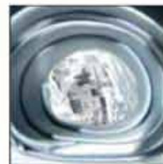
KZG-01 100% svila