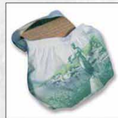
TORBA T-01OP-01 100% pamuk