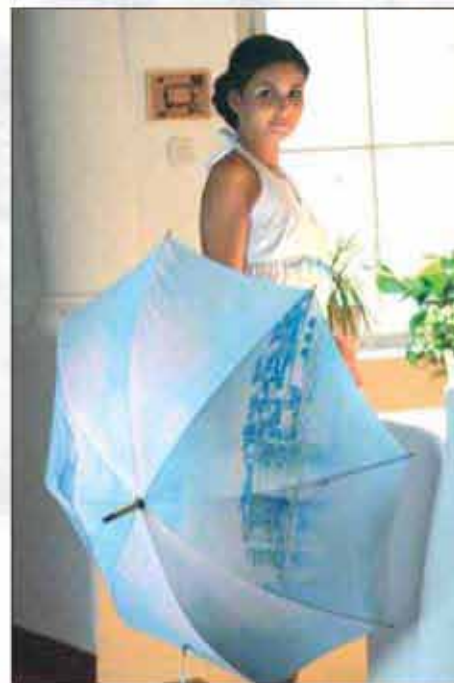
KIŠOBRAN DUBROVNIK DU-01