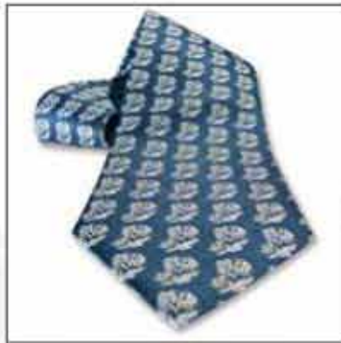
KPL-05 100% svila