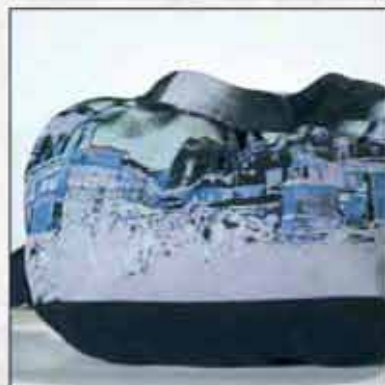
TORBA T-01ZG-02 100% pamuk