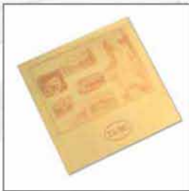
ETUI ZA MARAME I KRAVATE 02