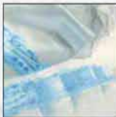
ŠAL DU-01 120x30cm 100% svila