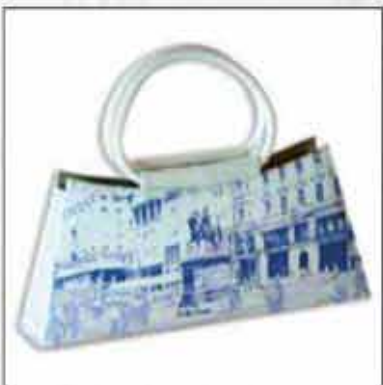
TORBA T-03ZG-01 100% koža 100% pamuk