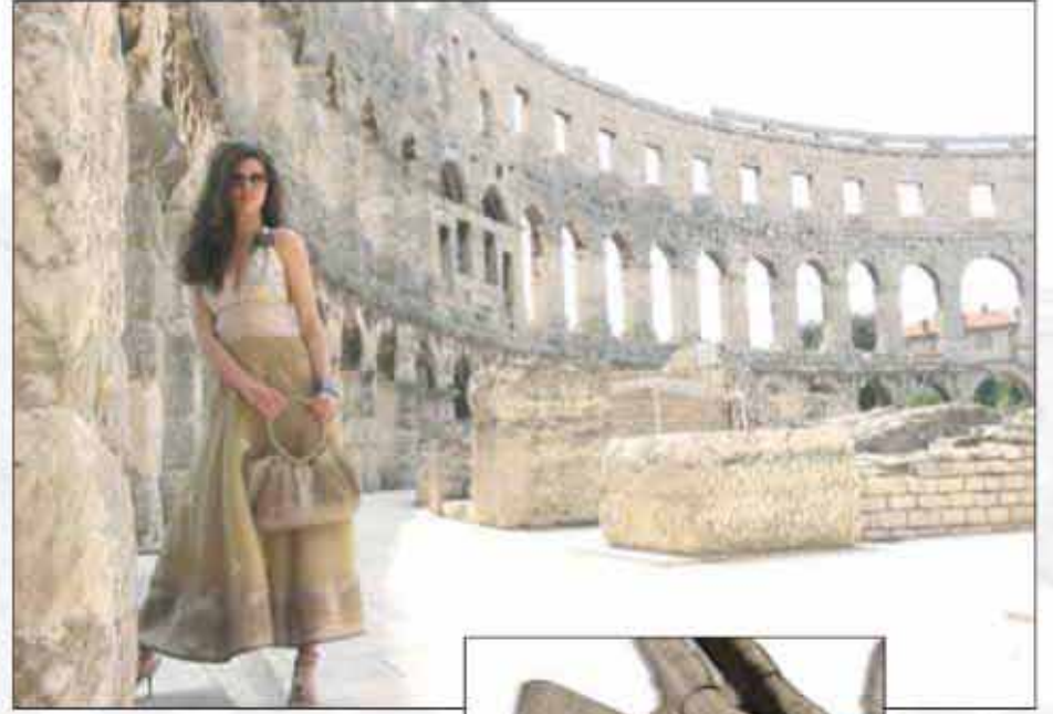
TORBA T-02AR-02 100% pamuk