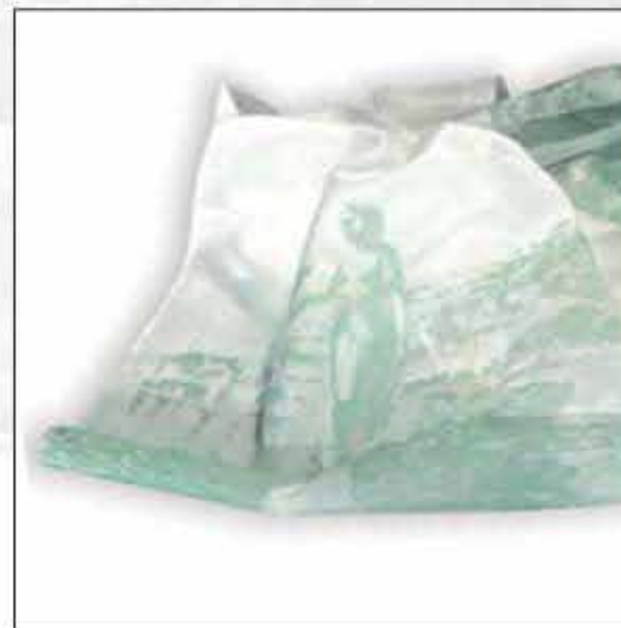
ŠAL OP-01 120x30cm 100% svila