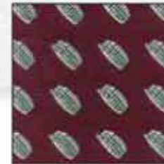
KAR-06 100% svila