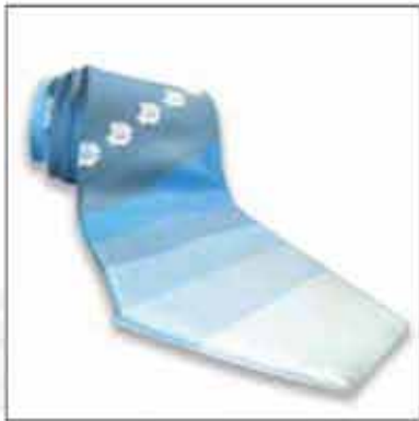
KPL-04 100% svila