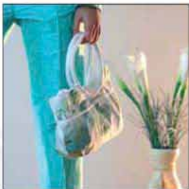
TORBA T-02OP-02 100% pamuk