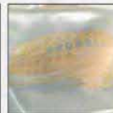
ŠAL AR-03 120x30cm 100% svila