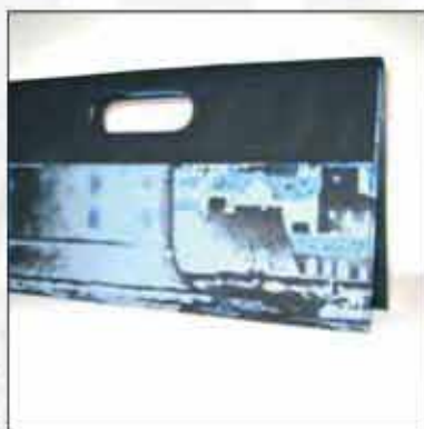
TORBA T-04DU-02 100% koža 100% pamuk