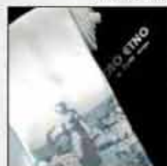
KOP-01 100% svila