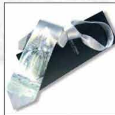
KPL-03 100% svila