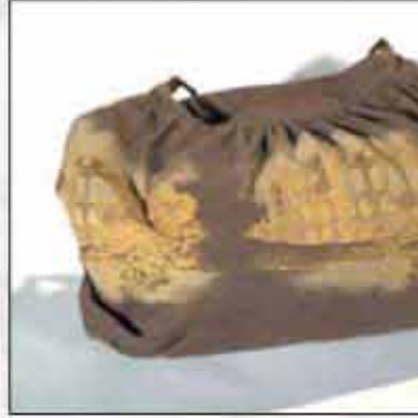
TORBA T-01AR-01 100% pamuk