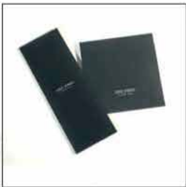
ETUI ZA MARAME I KRAVATE 01