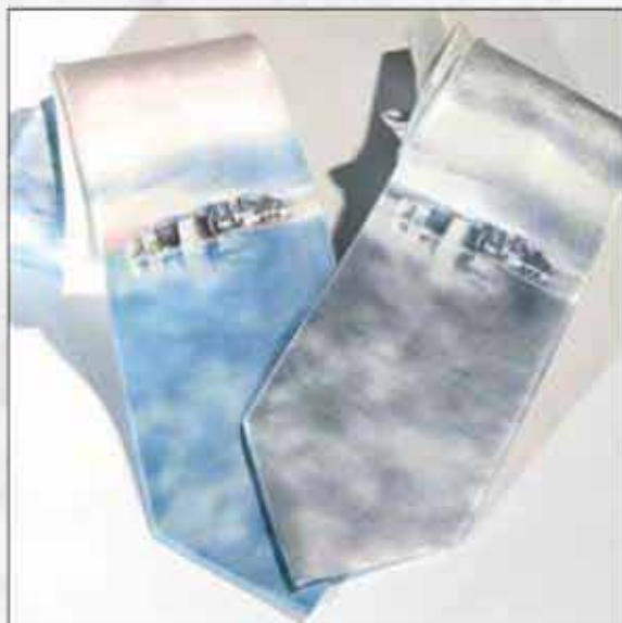
KDU-01 100% svila