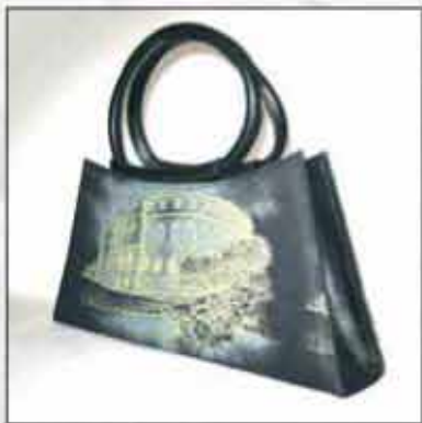
TORBA T-03AR-02 100% koža 100% pamuk