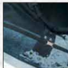
TORBA T-02DU-01 100% pamuk