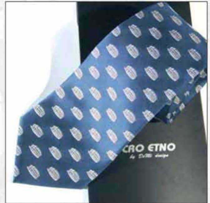
KAR-03 100% svila