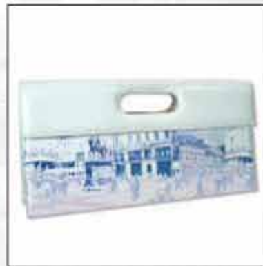
TORBA T-04ZG-01 100% koža 100% pamuk