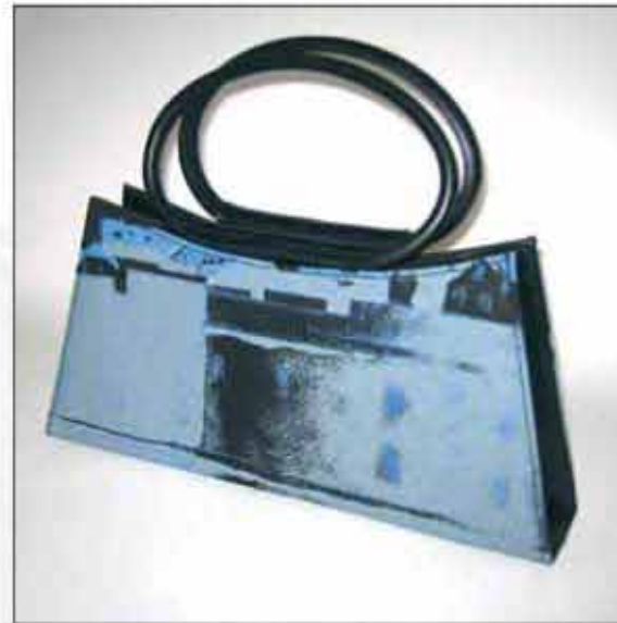
TORBA T-03DU-01 100% koža 100% pamuk