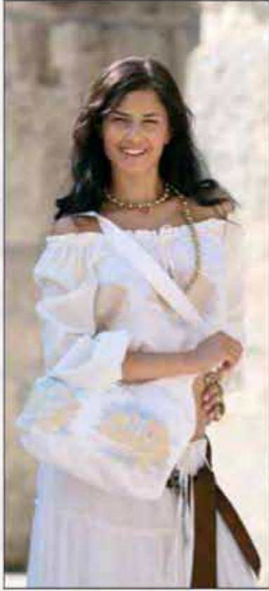
TORBA T-01AR-02 100% pamuk