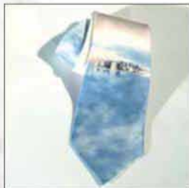
KDU-02 100% svila