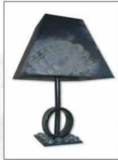
SVJETILJKE ARENA 1