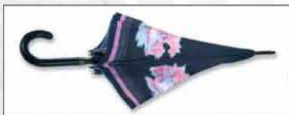
KIŠOBRAN PLITVICE PL-01