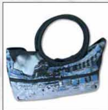
TORBA T-02ZG-02 100% pamuk