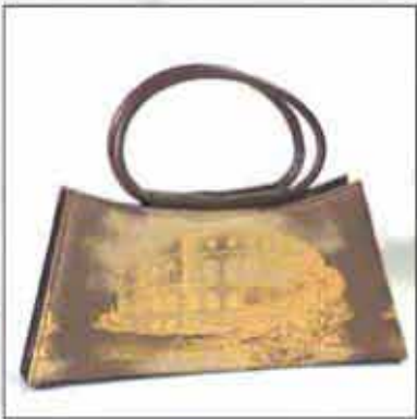
TORBA T-03AR-01 100% koža 100% pamuk