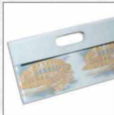
TORBA T-04AR-02 100% koža 100% pamuk