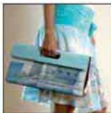
TORBA T-04DU-01 100% koža 100% pamuk