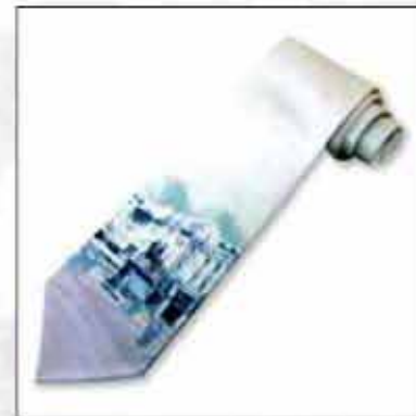
KZG-02 100% svila