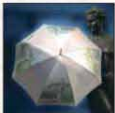
KIŠOBRAN OPATIJA OP-01