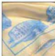
MARAMA AR-01 70x70cm 100% svila