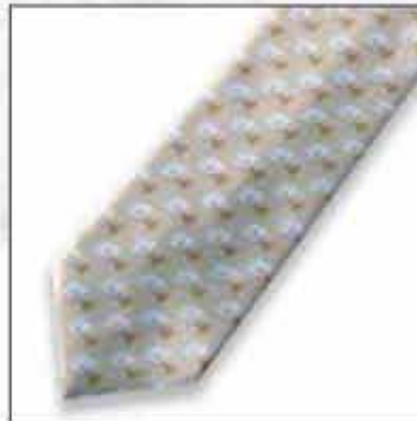
KAR-05 100% svila