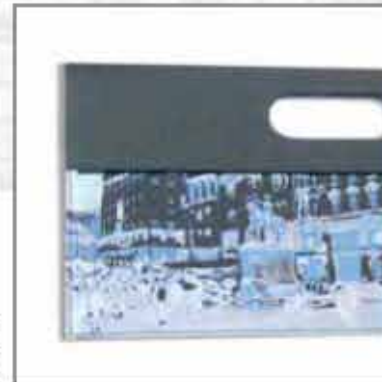
TORBA T-04ZG-02 100% koža 100% pamuk