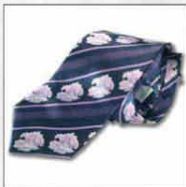
KPL-01 100% svila