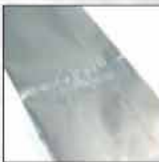
ETUI ZA KIŠOBRANE