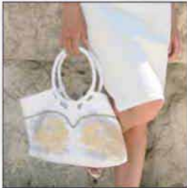
TORBA T-02AR-03 100% pamuk