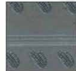
KAR-07 100% svila