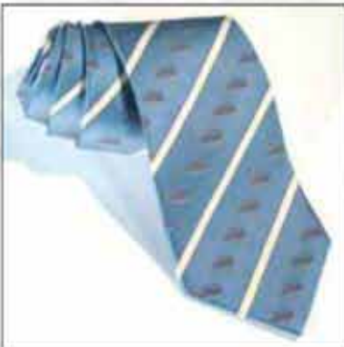
KAR-04 100% svila