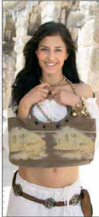
TORBA T-02AR-01 100% pamuk