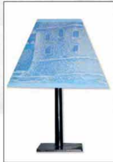
SVJETILJKE DUBROVNIK 2